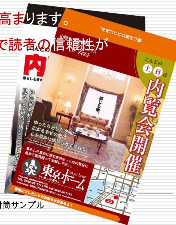
Prime One 封筒サンプル